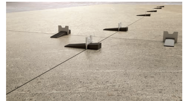
Get an excellent levelling of pieces with a perfect finishing. Consigue la nivelación de piezas deseada con un perfecto acabado.