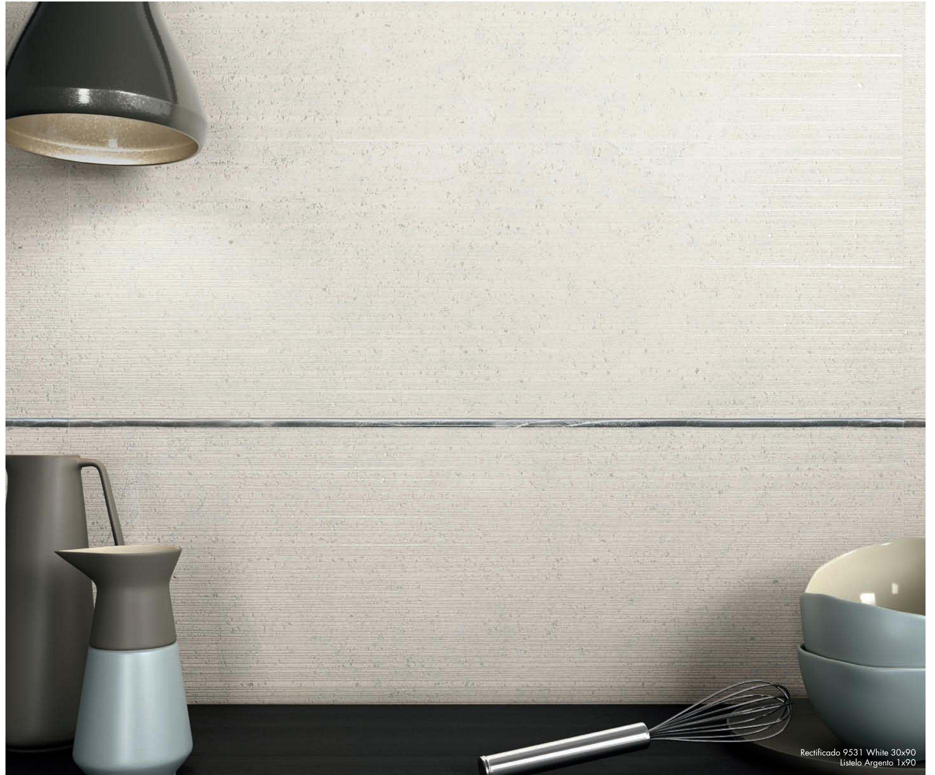
Rectificado 9531 White 30x90 Listelo Argentó 1x90

Una nueva gama de perfiles para combinar con cualquiera de nuestras colecciones de revestimiento. Una manera de reinterpretar el espacio multiplicando las posibilidades de decoración.