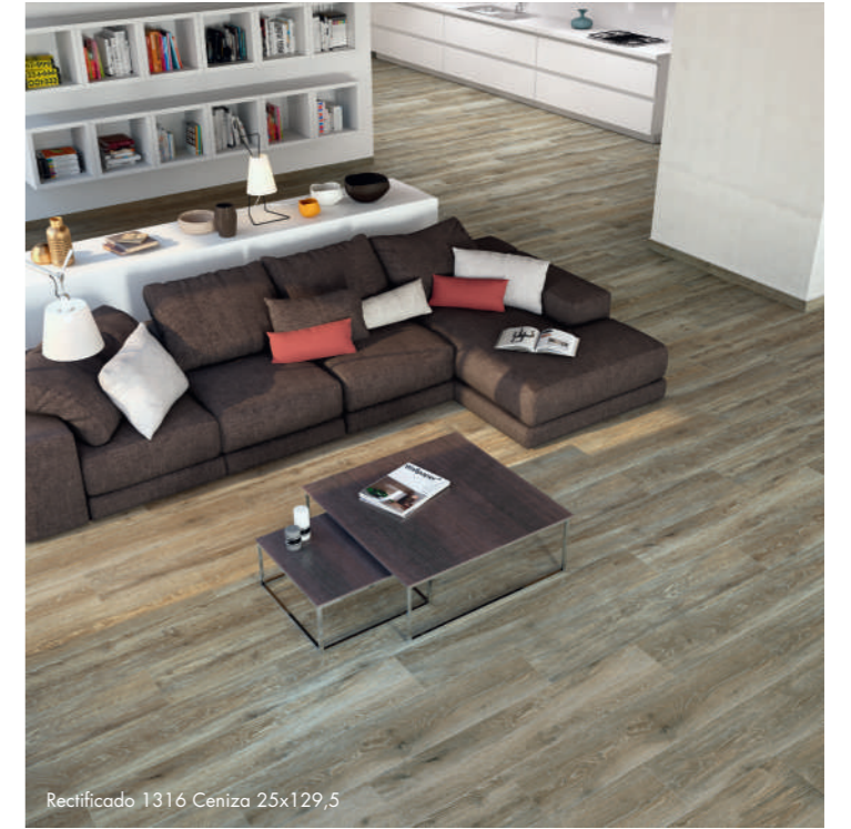
Rectificado 1316 Ceniza 25x129,5