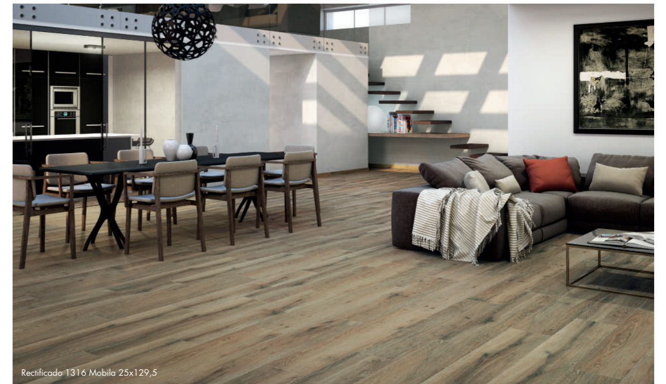
Rectificado 1316 Mobila 25x129,5